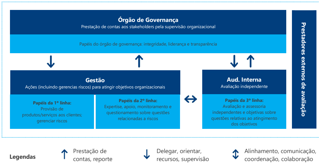
Quadro 1: Modelo de Três Linhas do The IIA.